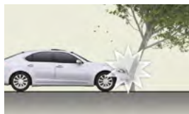
衝撞易變形之樹木等物體