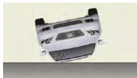
車輛翻滾或翻覆時