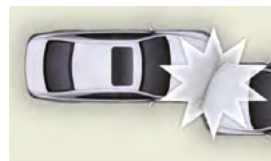
由偏離正面的角度衝撞