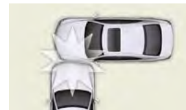
衝撞乘車空間以外的側面