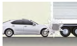
衝入卡車貨台下方等的追撞