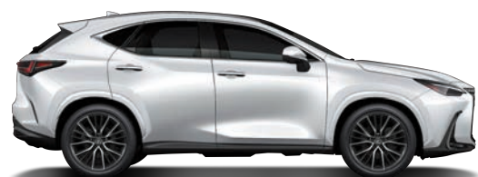
極光白 (085) (旗艦版、頂級版、豪華版、菁英版專屬)