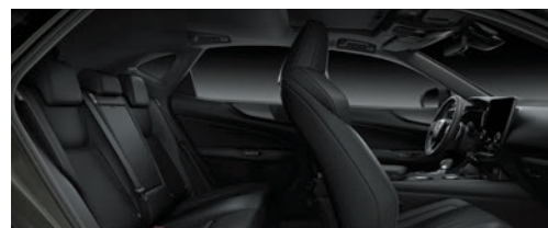
尊爵黑 (F SPORT 版專屬)*1