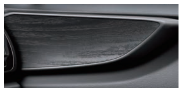
御匠黑柁飾板 (旗艦版專屬)