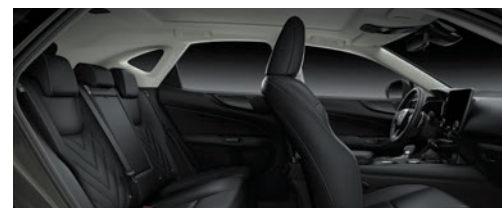
尊爵黑 (旗艦版、頂級版專屬)*2