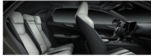
極淨白 / 尊爵黑 雙色