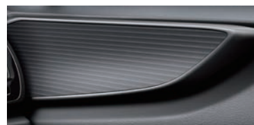
極競真鋁飾板 (F SPORT 版專屬)