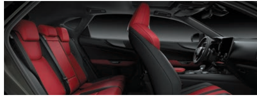
烈焰紅 / 尊爵黑 雙色