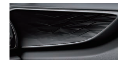
光雕藝塑飾板 (頂級版、豪華版、菁英版專屬)