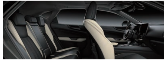
絲絨白 / 尊爵黑 雙色