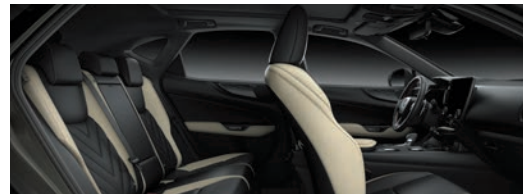
絲絨白 / 尊爵黑 雙色