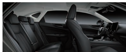
尊爵黑 (豪華版、菁英版專屬)*3