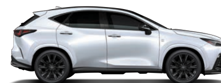
LFA 白 (083) (F SPORT 版專屬)