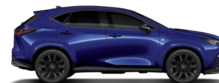
極焰藍 (8X1)* (F SPORT 版專屬)