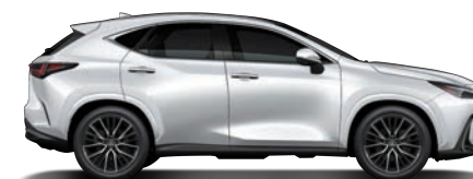
極光白 (085) (旗艦版、頂級版、豪華版、菁英版專屬)