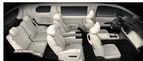
蒼穹白 (6人座、7人座專屬)