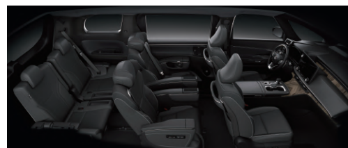
夜霧黑 (6人座、7人座專屬)