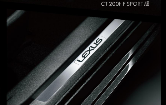
CT 200h F SPORT 版